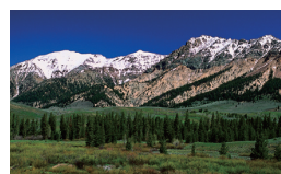
智慧節能模式，平均163W耗電量，同時強化黑色細節表現（舉例）