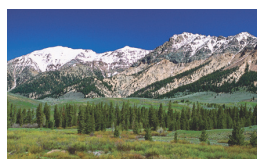
一般模式，平均296W耗電量（舉例）

按下SmartEco™智慧節能模式按鍵，BenQ投影機將根據內容的變化，自動調節兼顧最佳影像亮度、最省電力消耗，並提供最佳對比表現。比起一般投影機，SmartEco™智慧節能系列投影機每年可省下總計成本約30,945元。